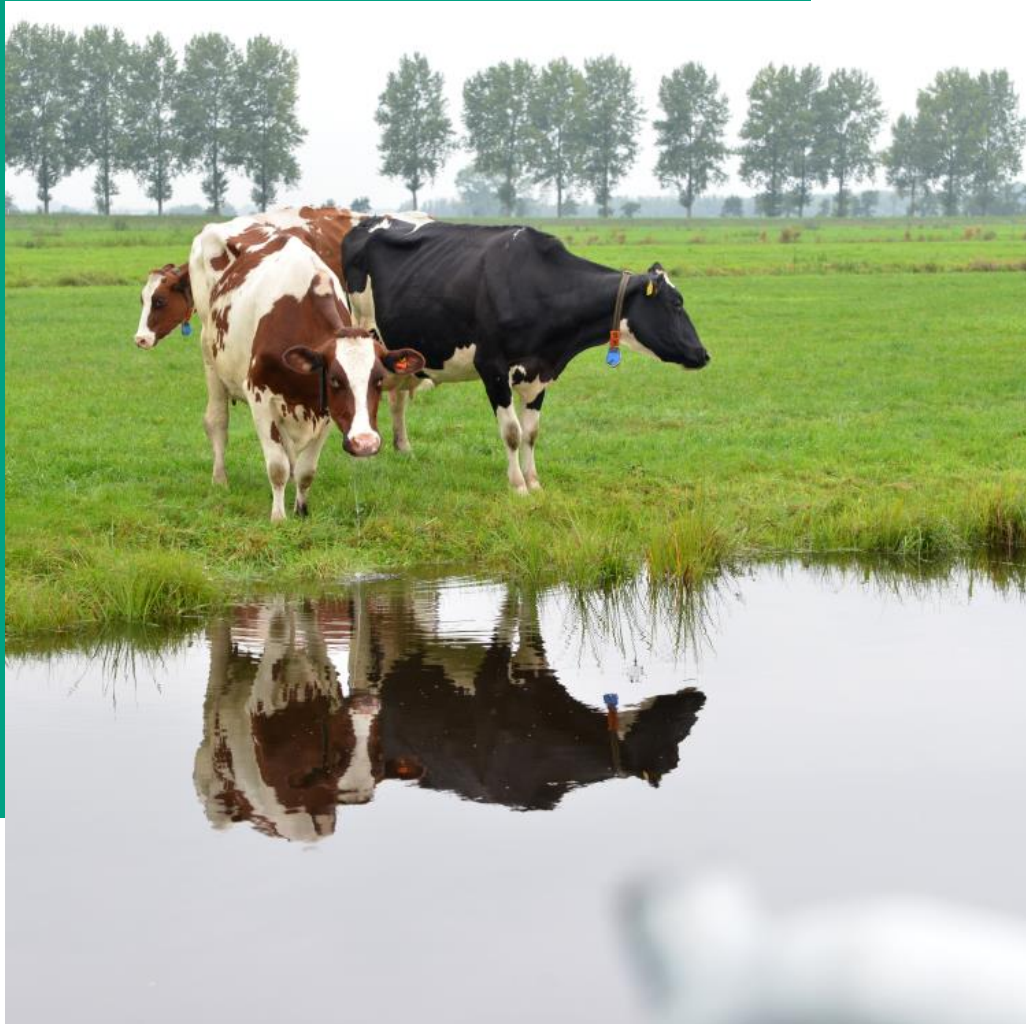
Visie landbouw en voedsel provincie Utrecht