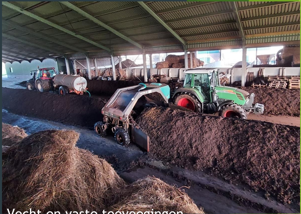
Vocht en vaste toevoegingen