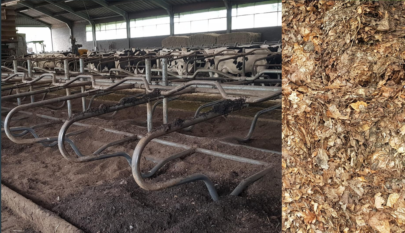
Diepstrooiselboxen met bladvulling